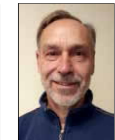
Gerd Herdel Logistik