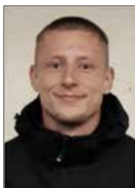
Frederik Gottschalk Landschafts- bau